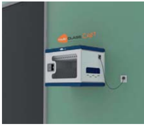
Colgado a la pared