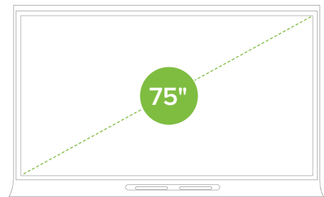
SMART Board 6075