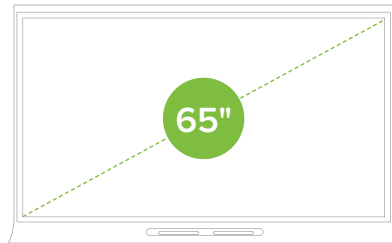
SMART Board 6065