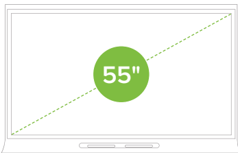
SMART Board 6055

Tenga la flexibilidad de equipar aulas y entornos corporativos como mejor le convenga. Hay puntos de montaje disponibles para mini PC c